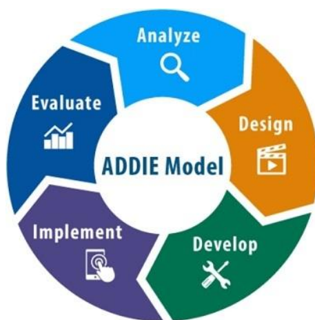
Gambar 3. Model ADDIE

Pengembangan platform financial technology pendayagunaan dana sosial bank syariah untuk pemberdayaan UMKM pada era digital menggunakan model ADDIE (Ranahresearch.com, 2020) yang terdiri dari lima tahap sebagaimana bagan berikut: