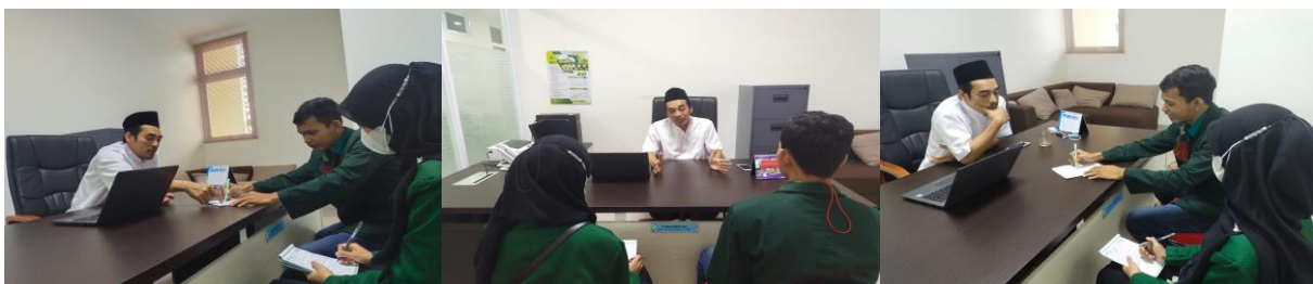
Gambar 1. Focus Group Discussion

Untuk menghasilkan hasil yang akurat, data yang telah diperoleh dikaji secara menyeluruh. Model yang dikaji kemudian dirumuskan setelah data yang terkumpul dianggap telah memadai. Selanjutnya, dalam upaya menjawab permasalahan penelitian, model tersebut dikembangkan dan dirangkai dalam bentuk pembahasan berdasarkan teori yang relevan dengannya. Dalam penelitian ini, sumber data sekunder dianalisis dengan menggunakan metode content analysis sesuai dengan kebutuhan yang telah ditetapkan oleh peneliti (Yusuf, 2014).