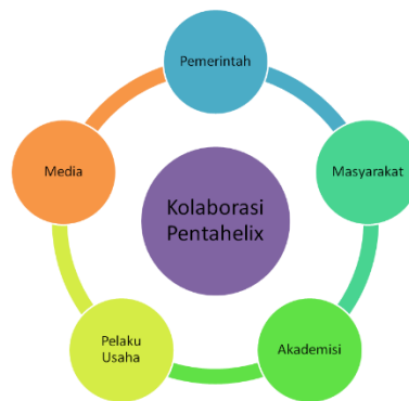
Gambar 4. Model Kolaborasi Pentahelix

Keterangan: (1) Akademisi, yaitu institusi pendidikan tinggi dan akademisi yang mempelajari mengenai platform financial technology serta menyebarkan kesadaran akan platform tersebut kepada kelompok masyarakat yang lebih luas, terutama para pelaku UMKM. Melalui UMKM Center , akademisi juga dapat membantu UMKM untuk menjadi lebih kuat. (2) Pelaku usaha, seperti bank syariah yang akan menyalurkan daya sosialnya dan pelaku UMKM yang akan terbantu untuk memperoleh bantuan pembiayaan melalui platform financial technology ini. (3) Media, yang berperan untuk membantu mempublikasikan platform financial technology ini secara luas agar dapat diketahui oleh masyarakat khususnya pelaku UMKM. (4) Pemerintah, khususnya pemerintah pusat dan daerah, melalui kementerian/dinas terkait dan lembaga yang berwenang seperti Otoritas Jasa Keuangan (OJK), yang dapat membantu dalam hal perizinan, pengarahan, dan pengawasan platform financial technology ini. (5) Masyarakat, dalam hal ini diwakili oleh Asosiasi Fintech Syariah Indonesia dan Dewan Syariah Nasional Majelis Ulama Indonesia, yang akan bertugas untuk memastikan bahwa platform financial technology ini sesuai dengan syariah.