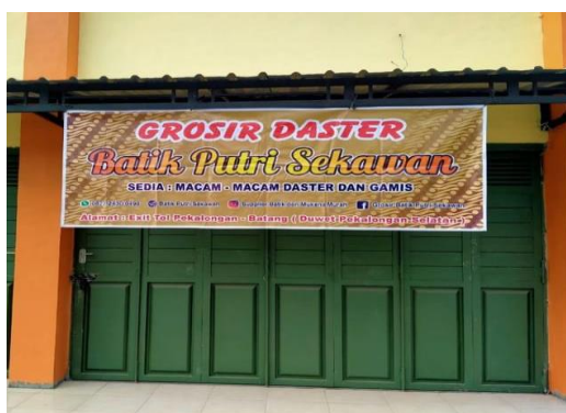
Gambar 1. Toko Batik Putri Sekawan

Gambar 1. Toko Batik Putri Sekawan merupakan sebuah UMKM pakaian yang berada di Pekalongan. UMKM ini menjual berbagai macam pakaian batik, daster maupun koleksi blouse-b blouse baru yang sesuai dengan perkembangan trend fashion. Toko Batik Putri Sekawan terletak di Kawasan Exit tol Batang, Kecamatan Warungasem, Kabupaten Batang. Toko Batik Putri Sekawan termasuk bisnis yang sudah lama berdiri dari sekitar tahun 2019. Awalnya Nisak sebagai Owner bisnis hanya menjual 1 macam model pakaian yaitu kemeja batik. Namun, seiring berjalannya waktu terutama saat terjadi pandemic covid, dimana banyak masyarakat melaksanakan hampir semua kativitasnya di Rumah, permintaan terhadap pakain lain di toko batik putrid sekawan pun tinggi. Sehingga, owner mencoba membuat dan menambah produksi pakaian rumahan lain berupa daster dan pakaian batik lain untuk memenuhi permintaan pasar. Hal ini ternyata berdampak besar terhadap perkembangan toko batik putrid sekawan hingga saat ini.