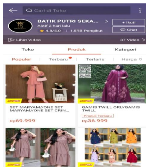
Gambar 4. Akun Shopee

Hasil penelitian ini menunjukkan bahwa penggunaan marketplace , khususnya Shopee, WhatsApp, dan Telegram, telah berhasil meningkatkan penjualan Toko Batik Putri Sekawan. Dukungan dari temuan penelitian terdahulu dan teori pemasaran online mendukung keefektifan strategi ini. Oleh karena itu, strategi pemasaran melalui marketplace dapat dianggap sebagai pendekatan yang relevan dan efektif bagi UMKM dalam meningkatkan eksposur produk dan penjualan mereka dalam era digital yang kompetitif. Diversifikasi strategi pemasaran melalui tiga marketplace berbeda (Shopee, WhatsApp, dan Telegram) terbukti berhasil dalam mencapai berbagai kelompok pelanggan. Ini mengurangi risiko ketergantungan pada satu sumber penjualan dan