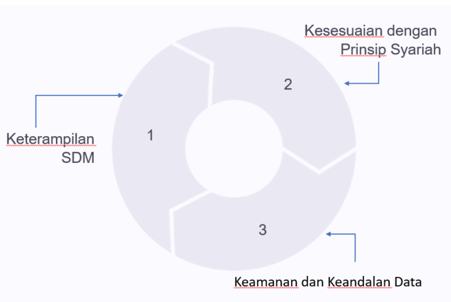
Gambar 3 Tantangan Implementasi Sistem Informasi Akuntansi Syariah

Keamanan data menjadi salah satu tantangan terbesar dalam implementasi SIA. Lembaga keuangan syariah perlu menerapkan sistem enkripsi tingkat tinggi untuk melindungi informasi keuangan mereka dari ancaman kejahatan siber seperti pencurian atau manipulasi data. Menurut Al-Okaily et al. (2020), keamanan informasi menjadi salah satu faktor utama dalam efektivitas sistem informasi akuntansi.