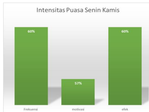
Gambar 1. Intensitas Puasa Senin Kamis

Hasil penelitian berdasarkan kuesioner dari gambar 4.1 menunjukkan bahwa frekuensi dari intensitas puasa senin kamis pada remaja putri di LKSA Taman Harapan Muhammadiyah Kota Bandung ternyata 60% remaja putri konsisten dalam melaksanakan ibadah puasa rutin melaksanakan puasa senin kamis karena di LKSA Taman Harapan menerapkan aturan agar anak asuh belajar untuk bisa melaksanakan puasa senin kamis meskipun puasa ini termasuk kedalam puasa sunnah.