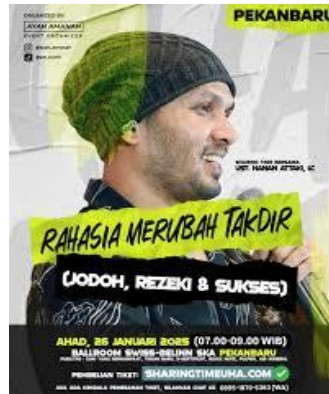
Gambar 2. Contoh Tema Kajian Sharing Time