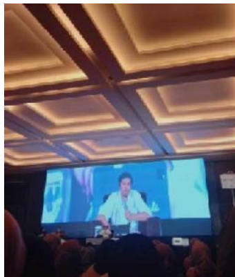
Gambar 1. Cuplikan Kajian Sharing Time Ustadz Hanan Attaki

Kegiatan Sharing Time Bersama Ustadz Hanan Attaki ini telah dilakukan sejak tahun 2020 dan diselenggarakan di berbagai kota-kota Indonesia seperti Jakarta, Surabaya, Purwokerto, Yogyakarta, Bandung, Bekasi dan lain-lain. Tema yang dibawakan berbeda-beda disetiap kota. Pada ceramah tersebut perharinya terbagi menjadi 4 sesi yakni sesi pagi, siang, sore dan malam. Pola ini menunjukkan adanya sistematisasi dan diferensiasi tema yang dirancang untuk menyasar berbagai sigma audiens. Dengan demikian, Sharing Time tidak hanya menjadi ruang edukasi keIslaman, tetapi juga menjadi model inovatif dalam menyampaikan pesan dakwah di era digital.