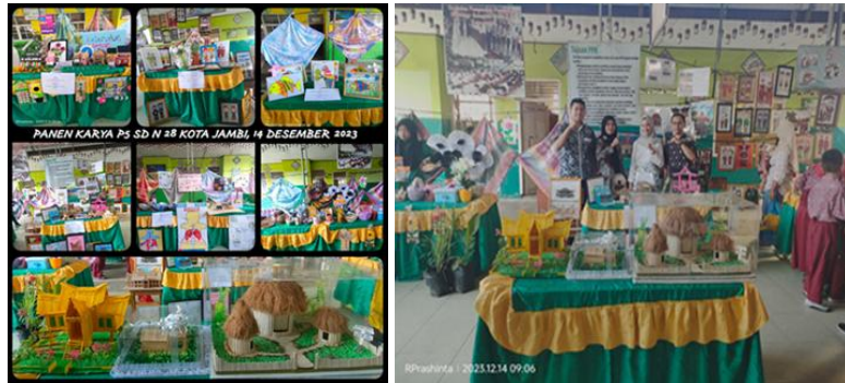
Gambar 5. Perayaan Hasil Belajar P5

Penutupan proyek P5 pada kelas IV SD Negeri 028/IV Kota Jambi dilakukan melalui refleksi dan tindak lanjut. Terdapat tiga kegiatan utama: (1) Perayaan hasil belajar melalui pameran gelar karya, di mana siswa mempresentasikan karya bersama kelompok kepada komunitas sekolah; (2) Refleksi terhadap proses dan hasil pameran; (3) Pengumpulan umpan balik dari pengunjung serta perencanaan tindak lanjut. Kegiatan ini bertujuan mengembangkan dimensi bernalar kritis siswa. Dokumentasi perayaan dapat dilihat pada Gambar 5.