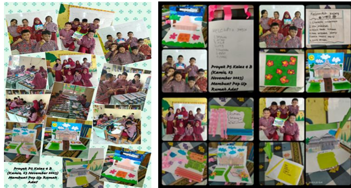
Gambar 3. Kegiatan Aksi P5

sebagai objek proyek. Kedua, mereka membuat peta pikiran dengan mengumpulkan dan mencatat informasi. Ketiga, siswa mempresentasikan hasil peta pikiran dan berdiskusi dengan teman. Keempat, mereka merancang tahapan pembuatan karya. Kelima, pelaksanaan proyek dilakukan secara kolaboratif dengan tanggung jawab individu. Keenam, siswa berlatih bersama untuk persiapan pameran. Ketujuh, dilakukan refleksi atas pengalaman kerja kelompok. Seluruh kegiatan ini bertujuan mengembangkan kemampuan bernalar kritis dan kolaboratif siswa.