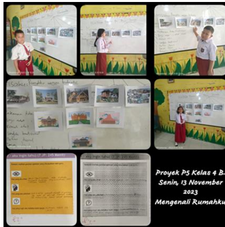
Gambar 1. Kegiatan Pengenalan

Sebagaimana ditunjukkan gambar 1, peserta didik melakukan pembelajaran bersama guru dalam hal pengenalan rumah adat menggunakan media gambar yang disediakan dari sekolah. Kemudian berdiskusi dan menjawab pertanyaan pemantik yang diberikan oleh guru mengenai hal yang telah mereka lihat. Setelah mengamati beragam rumah yang berbeda, siswa melakukan refleksi pembelajaran untuk melihat perkembangan peserta didik dalam memahami topik yang dipelajari telah dipelajari.