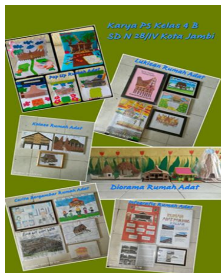
Gambar 4. Produk P5

Sebagaimana ditunjukkan gambar 3 Kegiatan aksi dapat berkontribusi dalam membangun dan memperkuat karakter Profil Pelajar Pancasila dimensi bernalar kritis dalam mengidentifikasi, mengklarifikasi, dan mengolah informasi dan gagasan. Adapun salah satu produk hasil P5 dapat dilihat pada gambar 4.