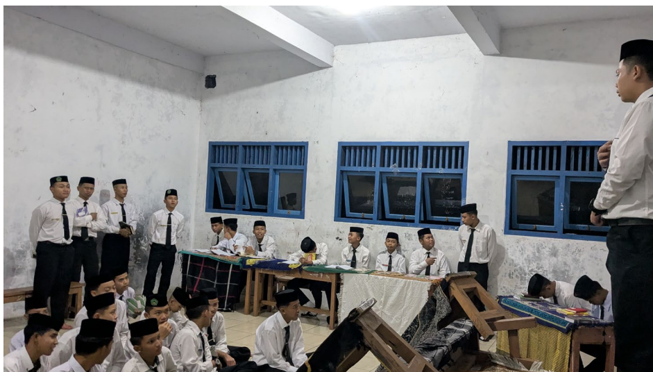
Gambar 3. Pelaksanaan Pelatihan Public Speaking

Praktik berbicara menjadi bagian utama dalam pelaksanaan pelatihan. Santri diberikan kesempatan untuk mempraktikkan teknik yang telah dipelajari melalui simulasi ceramah. Dalam konteks ini, fasilitator berperan sebagai pendamping yang memberikan arahan dan umpan balik secara konstruktif. Umpan balik diberikan secara langsung setelah santri tampil, sehingga peserta dapat segera memahami kelebihan dan aspek yang perlu diperbaiki. Pendekatan ini sejalan dengan teori komunikasi interpersonal yang menekankan pentingnya feedback dalam proses pembelajaran komunikasi.