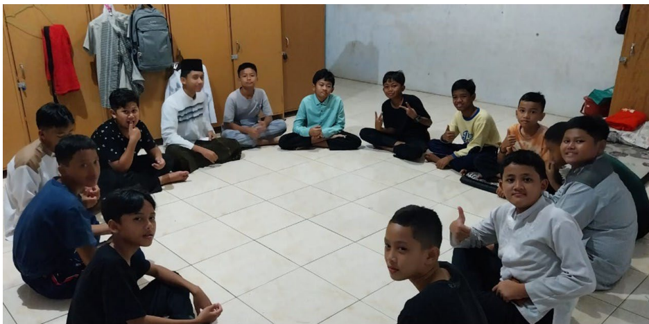
Gambar 4. Evaluasi Pelaksanaan Pelatihan Public speaking

Grafik 1 menunjukkan tren peningkatan linier pada seluruh indikator, dengan lonjakan paling signifikan pada aspek kepercayaan diri dan kesiapan tampil setelah sesi praktik intensif. Peningkatan kompetensi menunjukkan bahwa metode experiential learning efektif dalam membangun keterampilan komunikasi. Temuan ini sejalan dengan teori self-efficacy , di mana peningkatan kepercayaan diri berkontribusi langsung terhadap performa komunikasi. Dari perspektif dakwah, kemampuan adaptasi bahasa dan audiens menjadi indikator penting keberhasilan pelatihan. Program ini tidak hanya meningkatkan skill teknis, tetapi juga membentuk kesiapan peran sosial santri sebagai penceramah.