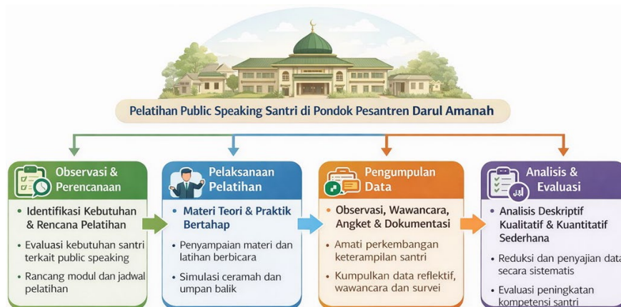
Gambar 1. Tahapan metode pengabdian

Gambar 1 menunjukkan bahwa tahapan metode pengabdian ini menyajikan alur pelaksanaan pelatihan public speaking bagi santri Pondok Pesantren Darul Amanah secara sistematis dan terstruktur. Setiap tahapan dirancang untuk memastikan proses pengabdian berjalan efektif, mulai dari pemetaan kebutuhan dan perencanaan program, pelaksanaan pelatihan berbasis teori dan praktik, pengumpulan data empiris, hingga analisis dan evaluasi hasil kegiatan. Alur ini mencerminkan pendekatan partisipatif-edukatif yang menempatkan santri sebagai subjek aktif dalam pembelajaran. Melalui tahapan yang saling terintegrasi tersebut, program pelatihan diharapkan mampu meningkatkan kompetensi komunikasi santri secara berkelanjutan dan menyiapkan kader penceramah yang profesional, percaya diri, serta relevan dengan kebutuhan dakwah di masyarakat.