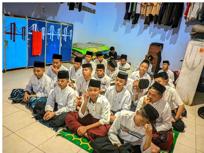
Gambar 2. Persiapan Pelatihan Public Speaking

Tahap perencanaan merupakan fondasi utama dalam menentukan efektivitas kegiatan pelatihan public speaking . Perencanaan kegiatan pengabdian ini diawali dengan pemetaan kebutuhan santri Pondok Darul Amanah terkait keterampilan berbicara di depan umum. Berdasarkan hasil observasi awal dan diskusi dengan pengelola pesantren, ditemukan bahwa santri memiliki penguasaan materi keagamaan yang memadai, namun belum diimbangi dengan kemampuan menyampaikan pesan secara komunikatif dan persuasif. Kondisi ini sejalan dengan pandangan teori komunikasi dakwah yang menegaskan bahwa keberhasilan dakwah tidak hanya ditentukan oleh kebenaran pesan, tetapi juga oleh cara penyampaiannya.