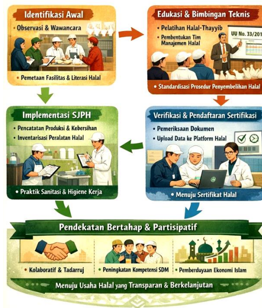
Gambar 1. Metode Pengabdian

Tim pengabdian mengawali tahapan kerja dengan melakukan identifikasi kondisi eksisting melalui observasi lapangan dan wawancara terstruktur bersama pengelola serta pekerja di Rumah Potong Unggas Ba'i Mulya. Proses ini bertujuan memetakan fasilitas fisik, alur produksi, serta tingkat literasi awal mitra mengenai regulasi sertifikasi halal yang ditetapkan oleh Badan Penyelenggara Jaminan Produk Halal. Tim pengabdian mengadopsi prinsip tadarruj atau pendekatan bertahap guna memastikan setiap langkah pendampingan selaras dengan kapasitas manajerial dan sumber daya manusia yang dimiliki unit usaha tersebut.