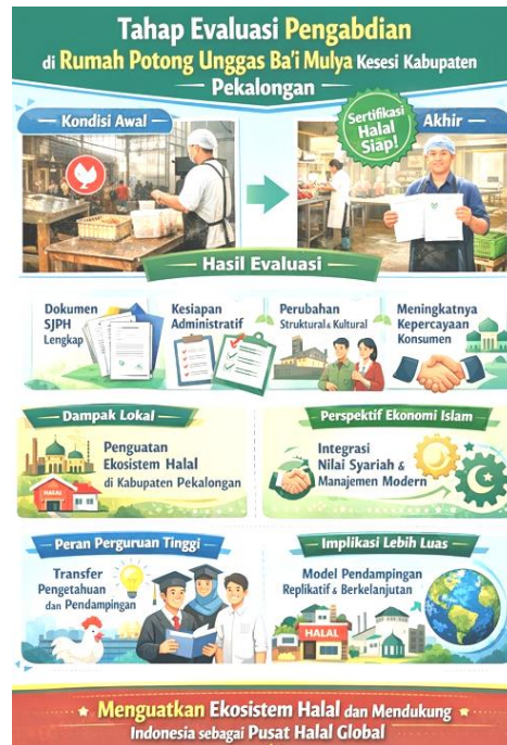
Gambar 3. Tahap Evaluasi Pengabdian

Evaluasi kegiatan ini dari perspektif ekonomi Islam telah menunjukkan bahwa integrasi antara nilai syariah dan pendekatan manajerial modern dapat meningkatkan efisiensi dan akuntabilitas usaha kecil. Sistem Jaminan Produk Halal berfungsi tidak hanya sebagai alat kepatuhan, tetapi juga sebagai mekanisme tata kelola yang mendorong keteraturan dan transparansi. Transparansi ini selaras dengan prinsip amanah dan hisab dalam Islam, di mana setiap aktivitas ekonomi dipertanggungjawabkan secara moral dan sosial. Temuan pengabdian ini menunjukkan bahwa pendampingan SJPH di Rumah Potong Unggas Ba'i Mulya tidak hanya berdampak secara kualitatif, tetapi juga menghasilkan perubahan yang terukur. Peningkatan pemahaman sebesar 35% mengindikasikan keberhasilan transfer knowledge, sementara peningkatan kompetensi teknis hingga 100% menunjukkan keberhasilan internalisasi praktik halal. Dalam perspektif human capital theory , peningkatan ini berimplikasi langsung terhadap kualitas proses produksi. Peningkatan kelengkapan dokumen sebesar 100% menegaskan bahwa kendala utama usaha kecil bukan pada resistensi terhadap regulasi, melainkan pada keterbatasan pendampingan teknis. Dengan demikian, intervensi berbasis pendampingan terbukti menjadi faktor kunci dalam akselerasi sertifikasi halal.