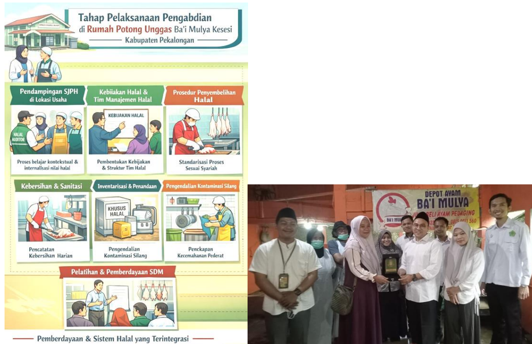
Gambar 3. Tahap Pelaksanaan Pengabdian

Perencanaan kegiatan pengabdian juga mempertimbangkan kajian regulasi Jaminan Produk Halal di Indonesia yang bersifat wajib dan terstandar. Dalam teori kelembagaan, regulasi formal sering kali tidak langsung efektif di tingkat pelaku usaha kecil apabila tidak disertai dengan mekanisme pendampingan dan penguatan kapasitas. Oleh karena itu, perencanaan pendampingan difokuskan pada penyusunan strategi yang aplikatif, dengan menurunkan ketentuan normatif SJPH ke dalam prosedur operasional yang mudah dipahami dan diterapkan oleh mitra. Pendekatan ini mencerminkan prinsip masalah dalam ekonomi Islam, yaitu upaya menghadirkan kemanfaatan nyata bagi pelaku usaha tanpa mengabaikan tujuan utama syariah.