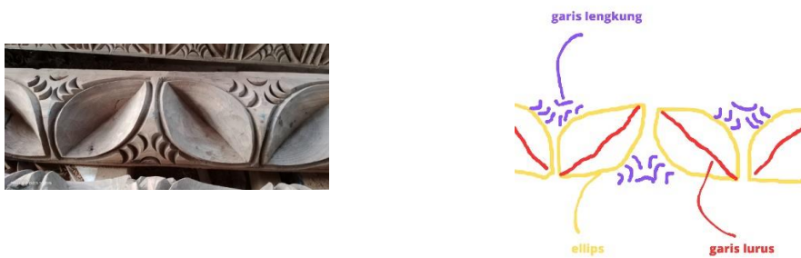
Gambar 7. Motif geometris pada tumpang