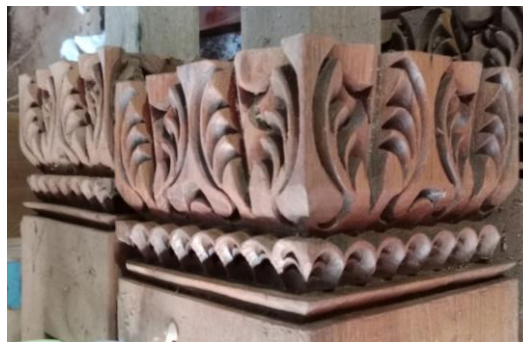
Gambar 14. Motif Geometris pada Umpak