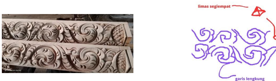
Gambar 8. Motif Daun Trubusan pada Tumpang