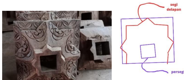
Gambar 13. Motif Geometris pada Umpak