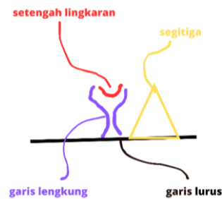
Gambar 4. Motif Geometris pada Tumpang