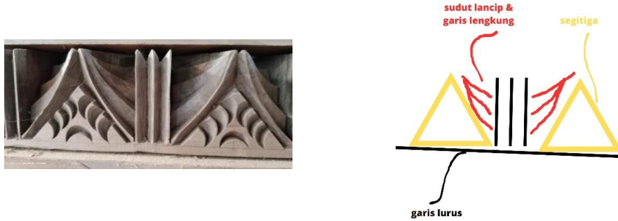
Gambar 6. Motif geometris pada tumpang