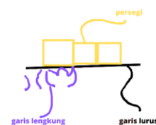
Gambar 5. Motif Geometris pada tumpang