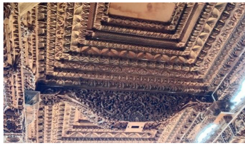
Gambar 3. Plafon Rumah Adat Jawa

Rumah adat Jawa sekarang ini sudah dimodifikasi dengan pemberian plafon. Akan tetapi kerangka-kerangka didalamnya masih tetap mempertahankan keaslian dari rumah adat Jawa pada umumnya. Dalam plafon rumah adat Jawa tersebut terdapat bentuk persegi. Selain itu ada beberapa bagian dari plafon rumah adat Jawa, yakni tumpang , sunduk kili , pengeret dan blandar . Setiap bagian memiliki motif dan bentuk geometri yang berbeda-beda. Berdasarkan hasil data yang didapatkan dari beberapa sumber pengrajin ukiran di daerah Kudus, diketahui bahwa dalam Rumah Adat Jawa terdapat konsep geometri yang disajikan dalam bentuk ukiran Kudus.