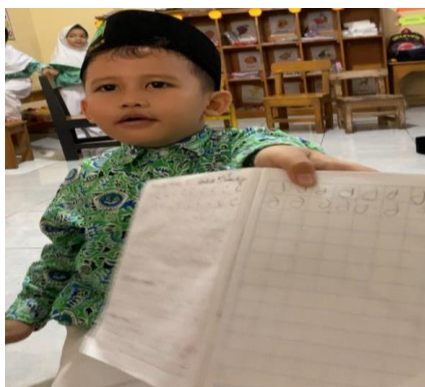
Gambar 4. Menebali Huruf

Gambar 1 menunjukkan cover buku AIGEM (Anak Islam Gemar Membaca). Gambar 2 berisi tentang pengenalan huruf abjad, vocal dan huruf hidup. Gambar 3 berisi tentang cara membaca kosa kata. Agar kegiatan ini dapat menumbuhkan cinta membaca, guru tidak langsung mengajarkan anak untuk menulis di buku tulis, melainkan memberikan kegiatan yang lebih sesuai dengan tahap perkembangan mereka. Gambar 4 menebalkan huruf atau menebali bentuk huruf menggunakan berbagai media untuk anak kelas B atau rentan usia 5-6 tahun. Kemudian untuk anak kelompok A rentan usia 4-5 tahun, guru mengajarkan dengan menyusun huruf menggunakan kartu huruf dan menggunakan bahan loosepart yang ada disekitar. Pembelajaran dilakukan secara menyenangkan dan individual (tatap muka), sehingga guru dapat memberikan perhatian penuh kepada setiap anak dan menyesuaikan metode pengajaran dengan kemampuan masing-masing.