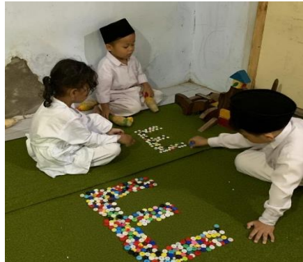
Gambar 5. Menyusun Huruf

sehingga mendukung perkembangan keterampilan literasi dan komunikasi mereka di masa depan (Nessa et al., 2023: 192-193).