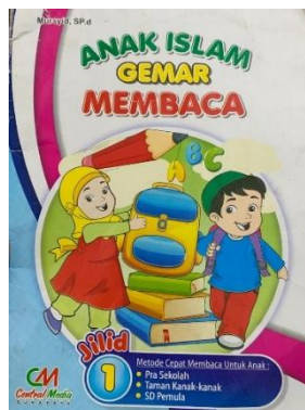
Gambar 1. Cover Buku AIGEM

Penggunaan berbagai media pembelajaran dalam program AIGEM juga menunjukkan penerapan prinsip pembelajaran yang berpusat pada anak. Buku AIGEM, kartu huruf, serta media konkret seperti kerikil, kancing, dan loose part memberikan pengalaman belajar yang bersifat multisensori. Anak tidak hanya melihat simbol huruf, tetapi juga menyentuh, menyusun, dan memanipulasinya secara langsung. Temuan ini sejalan dengan pendapat Mutahidah dan Khatir (2021) yang menyatakan bahwa pembelajaran membaca pada anak usia dini perlu dilakukan secara menyenangkan dan sesuai dengan tahap perkembangannya agar mampu meningkatkan motivasi belajar dan rasa percaya diri anak. Melalui kegiatan menebalkan huruf, menyusun huruf menjadi kata, serta membentuk huruf menggunakan benda-benda konkret, anak memperoleh pengalaman belajar yang lebih bermakna dibandingkan pembelajaran yang berorientasi pada latihan membaca dan menulis secara formal.