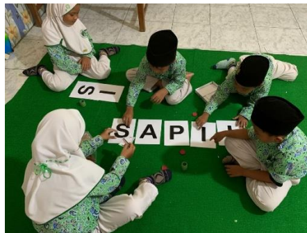
Gambar 6. Menyusun Kartu Huruf

Perbedaan strategi pembelajaran antara kelompok A (usia 4–5 tahun) dan kelompok B (usia 5–6 tahun) juga menunjukkan adanya penyesuaian terhadap tingkat perkembangan anak. Pada kelompok A, guru lebih menekankan kegiatan eksploratif seperti menyusun huruf menggunakan kartu huruf dan loose part. Sementara itu, pada kelompok B, anak mulai dikenalkan pada kegiatan menebalkan dan membentuk huruf sebagai persiapan menuju kemampuan menulis. Praktik ini sesuai dengan teori perkembangan kognitif yang menekankan bahwa pembelajaran harus disesuaikan dengan kesiapan dan kemampuan anak agar tidak menimbulkan tekanan belajar yang berlebihan. Dengan demikian, kegiatan AIGEM tidak hanya berorientasi pada hasil membaca, tetapi juga memperhatikan proses perkembangan anak secara bertahap.