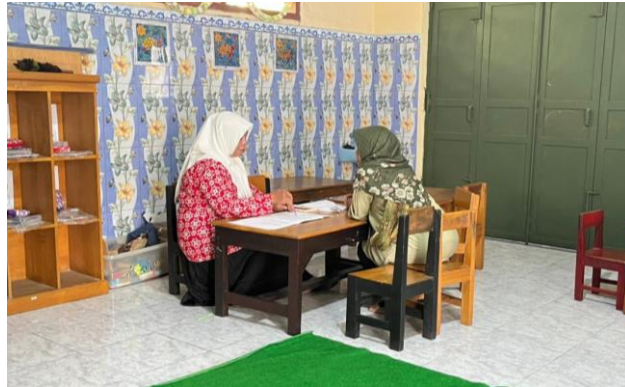
Gambar 7. Pertemuan triwulan

temuan tersebut, dapat dipahami bahwa keberhasilan program AIGEM dalam menumbuhkan cinta membaca pada anak tidak hanya berasal dari pelaksanaan kegiatan membaca itu sendiri, melainkan juga dari sinergi antara guru, orang tua, dan lingkungan belajar yang mendukung. Kolaborasi yang terbangun secara berkelanjutan memungkinkan anak memperoleh stimulasi literasi yang konsisten baik di sekolah maupun di rumah, sehingga minat dan kemampuan membaca dapat berkembang secara lebih optimal sejak usia dini.