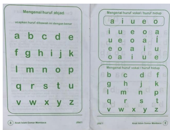
Gambar 2. Pengenalan Huruf Alfabet