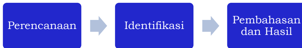
Gambar 2. Tahapan Systematic Literature Review

Ditahap yang ketiga atau hasil dan pembahasan yaitu pembahasan diskusi hasil dari artikel-artikel yang dipilih dalam bentuk deskripsi tulisan disertai tabel, diagram dan gambar untuk mendukung serta memperjelas SLR yang akan dipublikasikan dalam bentuk jurnal atau paper. Kemudian diakhiri dengan penarikan kesimpulan pembahasan dari artikel-artikel tersebut serta menjawab RQ yang sudah peneliti tetapkan di awal.